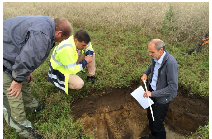
Probeschürf zur Wasserstandsprüfung