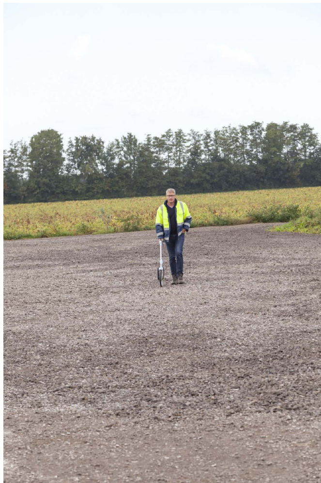
Markierungsarbeiten für den Rückbau der Montage- & Kranstellflächen