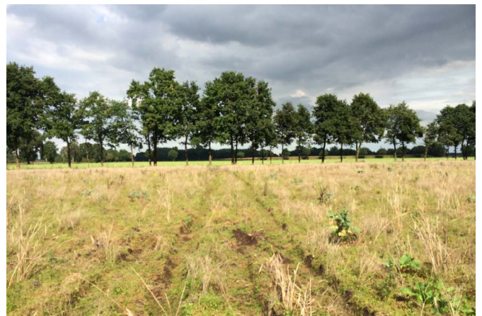
Überprüfung der nördlichen Fläche