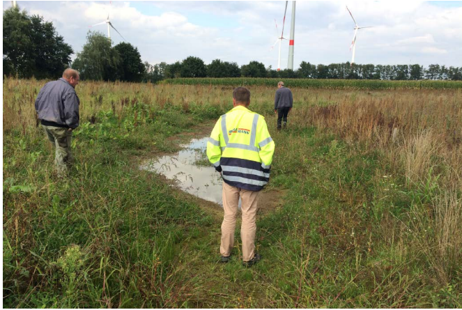
Begutachtung der südlichen Avifaunafläche