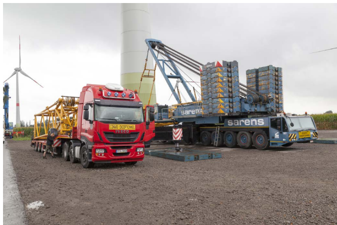
WEA 7 Kranabbau und Abtransport