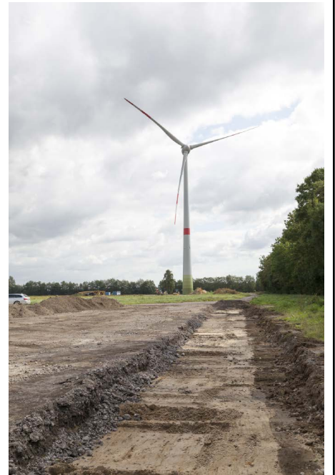
WEA 09 - Blick auf WEA 8