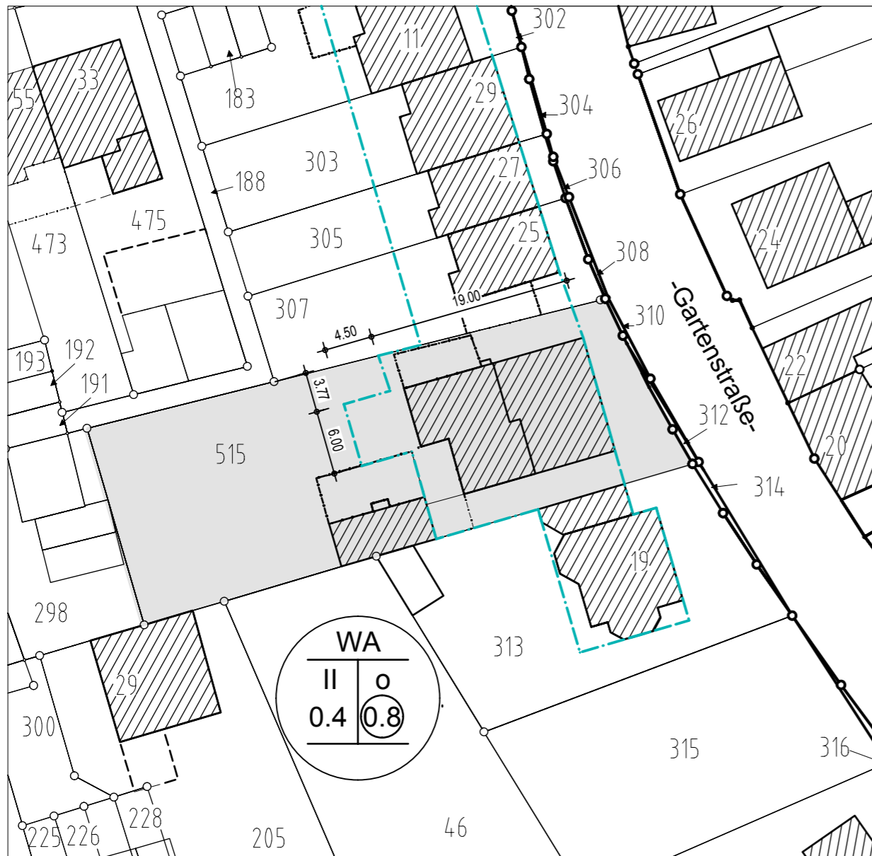
Auszug aus dem Bebauungsplan Weeze Nr.4, -Goethestraße- mit Darstellung des Geltungsbereiches der 19. vereinfachten Änderung