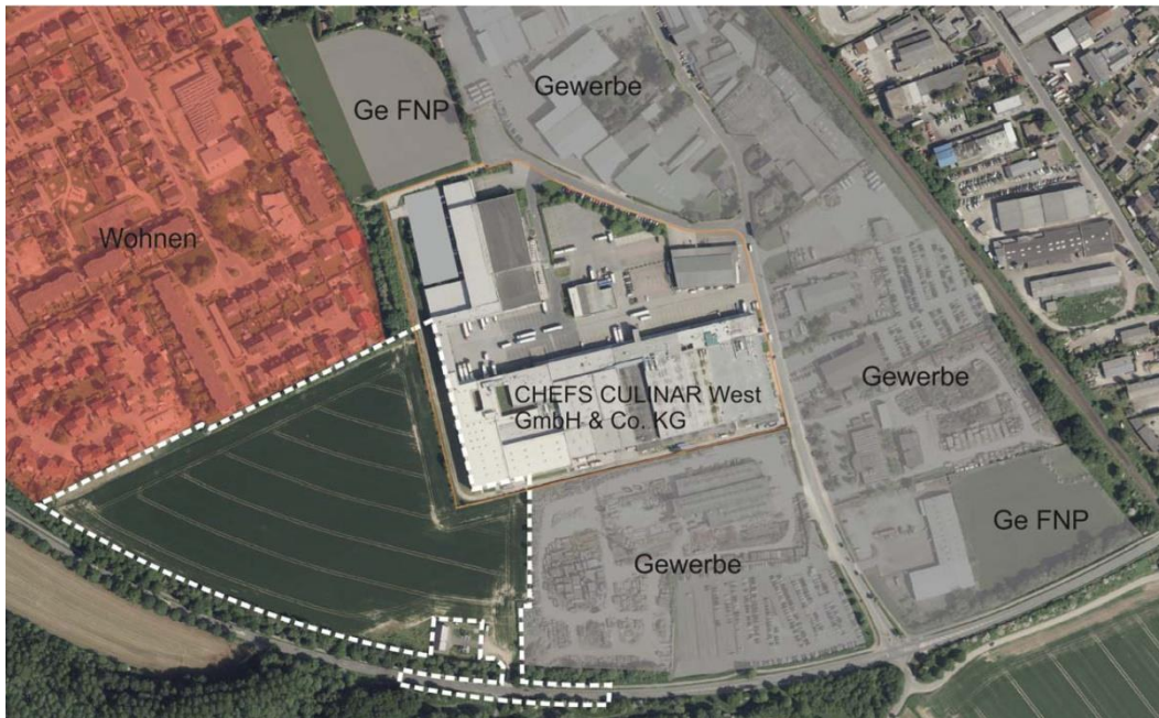
Abb. 2: Bestandsbetrieb und Umgebung (Geltungsbereich B-Plan)

Ein im Gewerbegebiet Weeze ansässiger Gewerbebetrieb des Lebensmittelgroßhandels mit positiver Unternehmensentwicklung als relevanter Arbeitgeber (mehr als 950 Mitarbeiter am Standort Weeze) benötigt für seine mittelfristige Entwicklung eine Erweiterungsfläche. Es besteht für die Erweiterung ein Flächenbedarf, der sich aus einer baulichen Entwicklungsfläche mit dazugehörigen Zufahrten, Stellplatz- und Hofflächen zum Be- und Entladen der Lkws und notwendigen Versickerungsflächen ergibt.