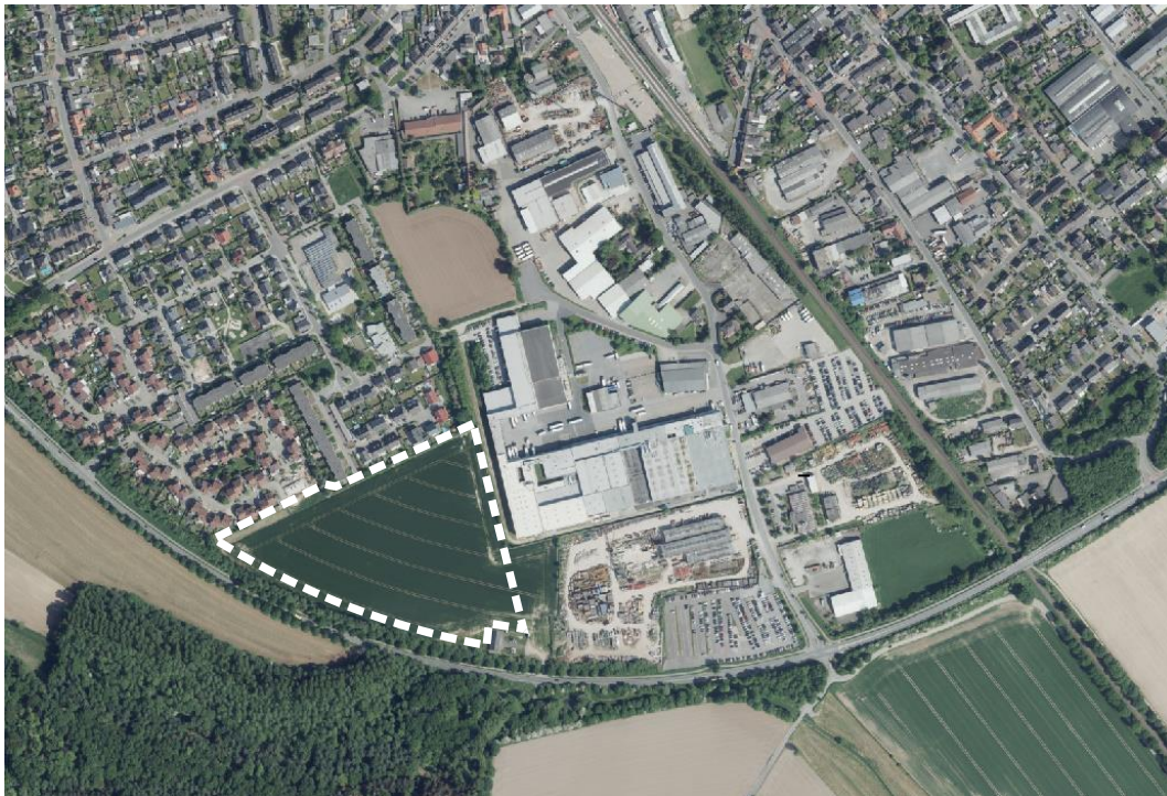
Abb. 1: Änderungsbereich der 39. Teilfortschreibung

Die 39. Änderung des FNPs liegt am südwestlichen Siedlungsrand der Gemeinde Weeze und umfasst teilweise das Flurstück 147 Gemarkung Wissen, Flur 10. Unmittelbar südlich grenzt die Südwesttangente L5 (Willy-Brandt-Ring) an die Fläche an. Westlich liegen die Wohnbauflächen der ehemaligen Briten-Siedlung um den York Way und an der Breslauer bzw. Ilmenauer Straße. Im Osten grenzt das bestehende Gewerbegebiet mit Betriebsflächen des Lebensmittelgroßhandels im Bereich Gastronomie und Gemeinschaftsverpflegung „Chefs Culinar West GmbH Co.KG“ und eines Bauunternehmens an.